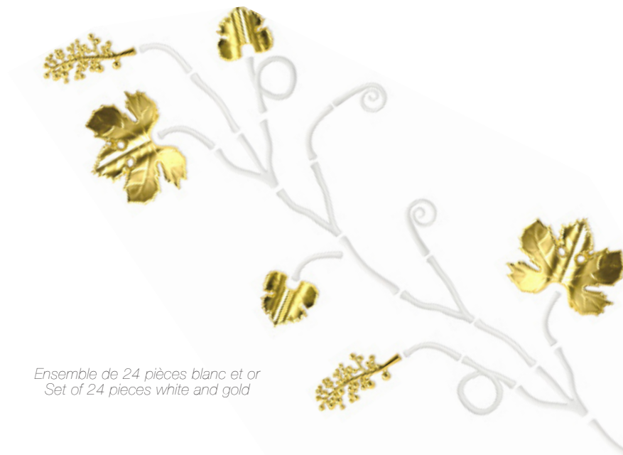
Ensemble de 24 pièces blanc et or Set of 24 pieces white and gold

"We knew of Andrea Branzi's work for some time and during his exhibit at the Cartier Foundation in Paris (march to june 2008), we arranged to meet with him. We asked him what he'd be interested in doing with porcelain. We decided to give him free rein so that he could come back to us with a project for which we'd given him absolutely no leads. Andrea Branzi's project is a wonderful point of inquiry and reflection on future projects involving the adaptation of porcelain in the universe of decorative art."