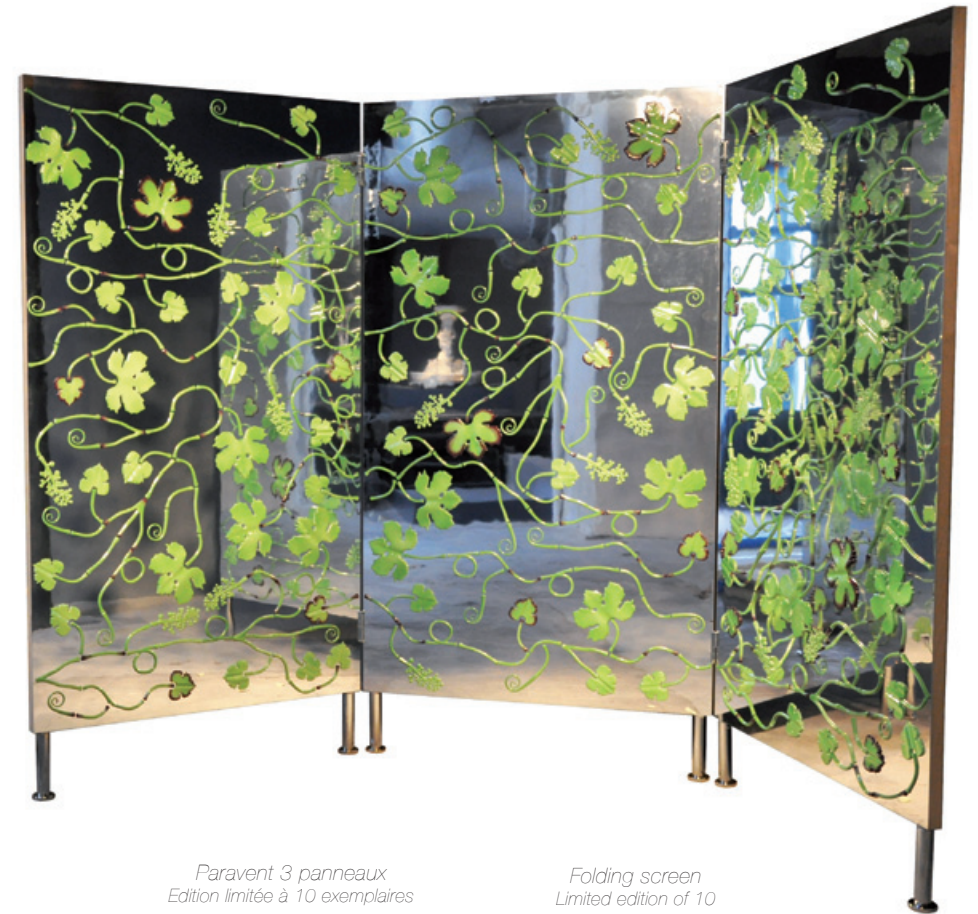
Paravent 3 panneaux Edition limitée à 10 exemplaires