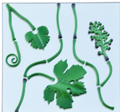
Miroir 45 x 45 cm Miror 18" x 18"

Né à Florence en 1938, Andrea Branzi est à l'origine de nombreuses idées novatrices qui ont nourri le design italien depuis la fin des années 1960. En tant que membre fondateur du groupe Archizoom (1966-1974), il est l'un des théoriciens de l'architecture radicale italienne, qui a inspiré toute une génération d'architectes tel que Frank Gehry, Rem Koolhaas et Daniel Libeskind. Dans les années 1970 et 1980, il a fait partie de cercles avant-gardistes, tel le groupe Memphis. Auteur et critique prolifique, il est l'un des cofondateurs de la Domus Academy, la célèbre école internationale de design de Milan, dont il fut directeur et vice-président durant dix ans. En 1987, il a obtenu le prestigieux Compasso d'Oro en récompense de ses contributions dans le domaine du design. Il est actuellement professeur et directeur -de recherche en design intérieur à l'école Politecnico de Milan, et conservateur du Museo del Design à la Triennale de Milan.