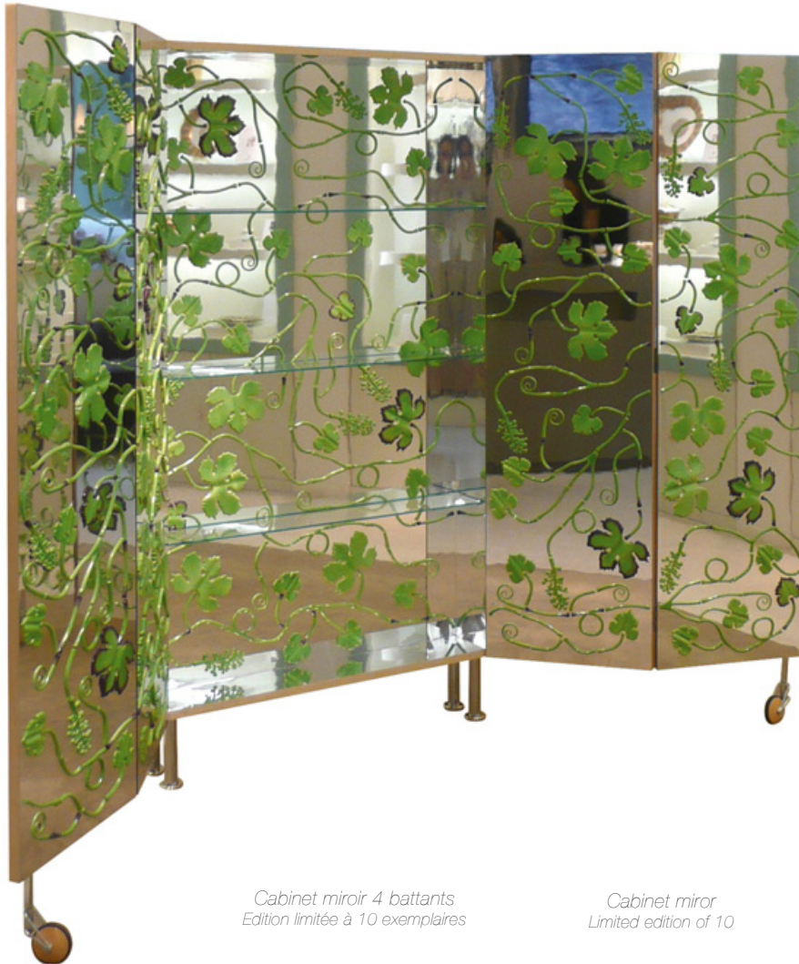
Cabinet miroir 4 battants Edition limitée à 10 exemplaires

La collection se compose d'un cabinet miroir 4 battants et d'un paravent 3 panneaux en éditions limitées, ainsi que 2 miroirs, et 3 ensembles de pièces en porcelaine à disposer selon votre imagination sur la surface de votre choix.