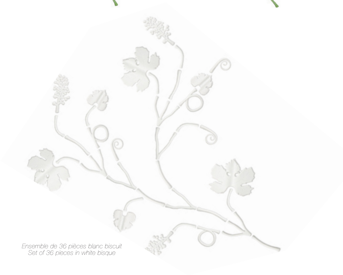
Ensemble de 36 pièces blanc biscuit Set of 36 pieces in white bisque