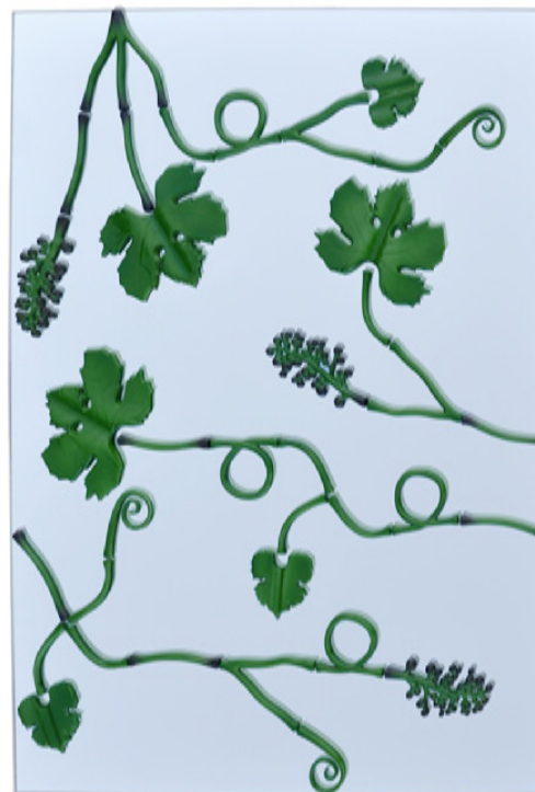
Miroir 95 x 75 cm Miror 37,5" x 29,5"

"As with all my projects, I began with the idea of creating not just an object but a part of the town, in other words, something with a broader concept of space. And as often happens, I took as my starting point a link between nature and architecture. So I suggested to Bernardaud this idea of a climbing vine standing on a mirror which is fitted to a folding screen, but which could also run along a wall and become a large-scale decoration: a sort of ornamental piece in 3D. By using porcelain, which is an elegant, historic material, you can create a simple end-result because the overall decoration is created by the combination of elements that gives a truly poetic feel to the space. The mirrors produce a very intense effect as the endless reflections become a sort of plant universe that could then be applied to walls using other colors such as the white, gold or green shown here."