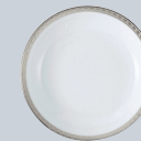
Coupelle 13 cm Fruit saucer 5"