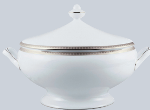
Soupière (2 L) Soup tureen (68 oz)

REF 23 26 53 127 133 125 95 55 34 183 1305-1 1304-1 1307-1