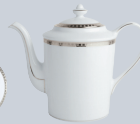
Cafetière (1 L) Coffee pot (34 oz)