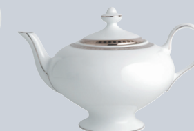
Théière (75 cl) Tea pot (25.5 oz)