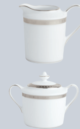
Crémier (30 cl) Creamer (10 oz)