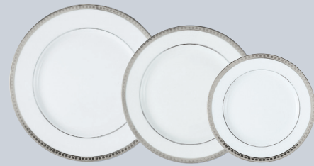
(or/gold - platine/platinum) Assiette plate 16 cm (pleine aile) Accent bread & butter plate 6 1/2" (full rim)