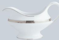
Saucière (25 cl) Gravy boat (8.5 oz)