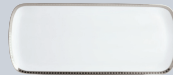
Plat à cake 37 cm Rectangular cake platter 15"