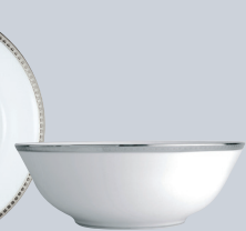
Compotier creux 24 cm Open vegetable dish 9 1/2"