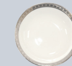
Coupelle 10 cm Small dish 4"