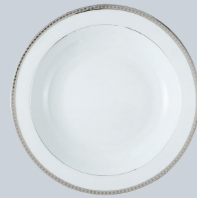
Plat rond creux 29 cm Deep round dish 11 1/2"