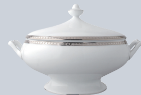
Légumier (1 L) Covered vegetable dish (34 oz)