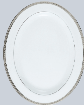
Plat ovale 43, 38 cm et 33 cm Oval platter 17", 15" and 13"