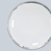
Assiette coupe 16 cm Coupe bread & butter plate 6 1/2"