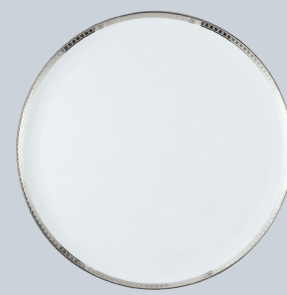
Plat à tarte 32 cm Round tart platter 13"