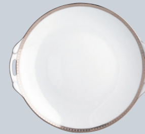
Plat à gâteaux 27 cm Cake plate with handles 11"