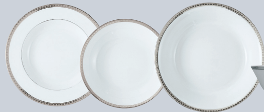
Assiette creuse à aile 22,5 cm Rim soup 9"

REF 7 5771 5763 13 17 3 115 121 97 2553-1 1302-1 1316-1 1303-1