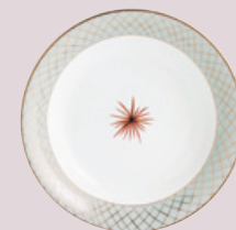
Compotier creux 24 cm Open vegetable dish 9 1/2''