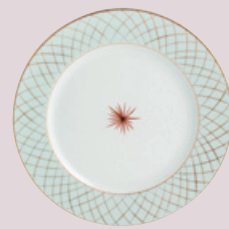
Assiette plate 26 cm Dinner plate 10 1/2''