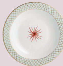
Plat rond creux 29 cm Deep round dish 11 1/2''