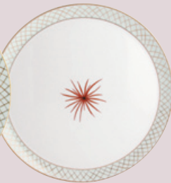
Plat à tarte 32 cm Round tart platter 13''