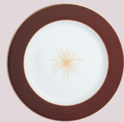
Assiette plate 29,5 cm Service plate 11 1/2''