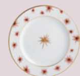
Assiette plate 16 cm Bread & butter plate 6 1/2''