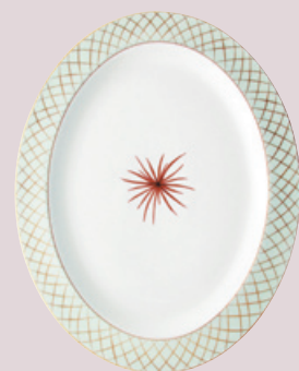
Plat ovale 38 cm et 33 cm Oval platter 15'' and 13''