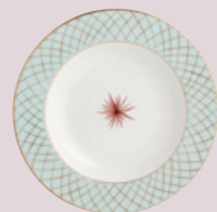
Assiette creuse à aile 22,5 cm Rim soup 9''