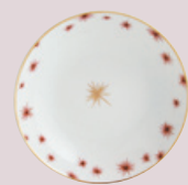
Assiette creuse calotte 19 cm Coupe soup 7 1/2''