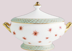
Soupière (2 L) Soup tureen (68 oz)