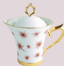
Verseuse (80 cl) Hot beverage server (27 oz)