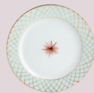
Assiette plate 21 cm Dessert plate 8 1/2''