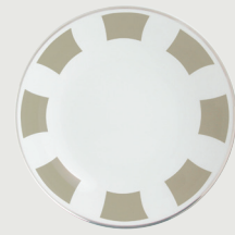
Assiette creuse calotte 19 cm Coupe soup 7 1/2"