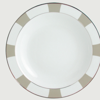
Plat rond creux 29 cm Deep round dish 11 1/2"