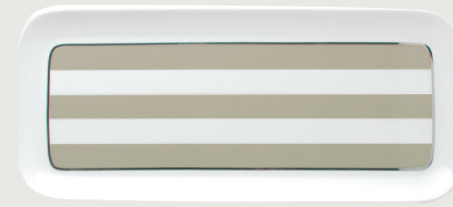
Plat à cake 37 cm Rectangular cake platter 15"