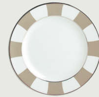
Assiette plate 16 cm Bread & butter plate 6 1/2"