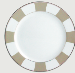
Assiette plate 21 cm Dessert plate 8 1/2"