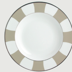
Assiette creuse à aile 22,5 cm Rim soup 9"