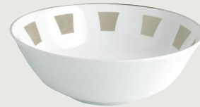
Saladier 25 cm (1,7 L) Salad bowl 10" (57 oz)