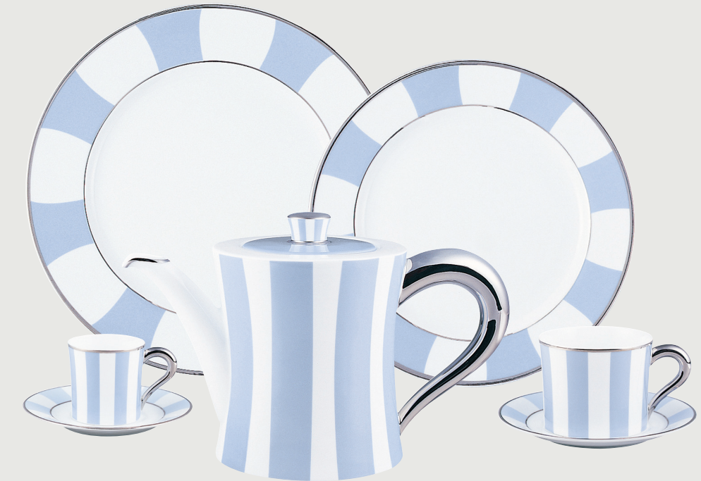
GALERIE ROYALE BLEU WALLIS