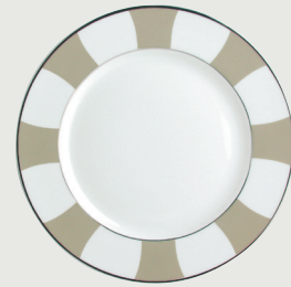
Assiette plate 26 cm Dinner plate 10 1/2"