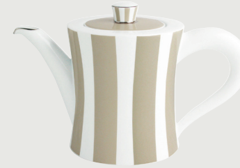
Cafetière (1 L) Coffee pot (34 oz)