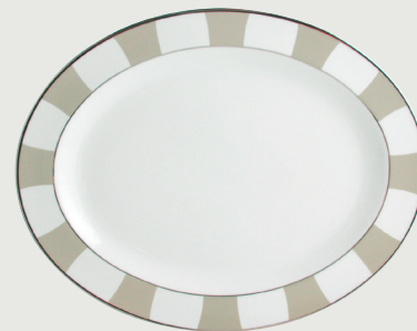
Plat ovale 33 cm Oval platter 13"