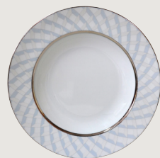
Assiette creuse à aile 22,5 cm Rim soup 9"