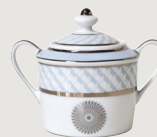
Sucrier (20 cl) Sugar bowl (7 oz)