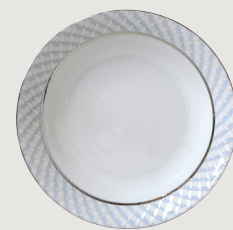
Compotier creux 24 cm Open vegetable dish 9 1/2"