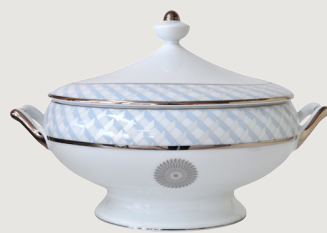
Soupière (2 L) Soup tureen (68 oz)