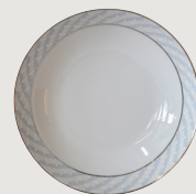
Assiette creuse calotte 19 cm Coupe soup 7 1/2"