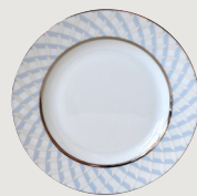
Assiette plate 16 cm Bread & butter plate 6 1/2"