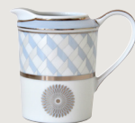
Crémier (30 cl) Creamer (10 oz)