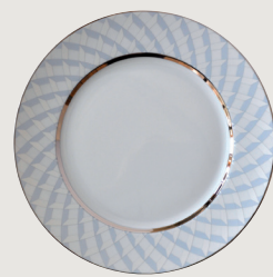
Assiette plate 26 cm Dinner plate 10 1/2"