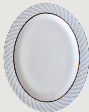
Plat ovale 38 cm et 33 cm Oval platter 15" and 13"