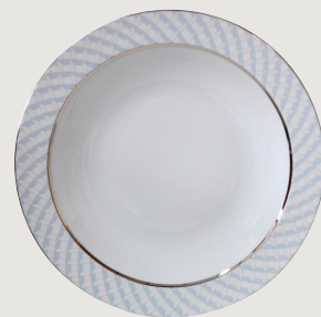
Plat rond creux 29 cm Deep round dish 11 1/2"