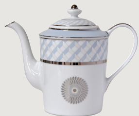
Cafetière (1 L) Coffee pot (34 oz)