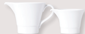
Crémier Shogun • Shogun creamer

GM 15 cl D. 9 cm H. 7,5 cm / Large 5 oz D. 3.5" H. 2.9" 5100/5569 PM 7 cl D. 7 cm H. 5,5 cm / Small 2.4 oz D. 2.8" H. 2.2" 5100/5568