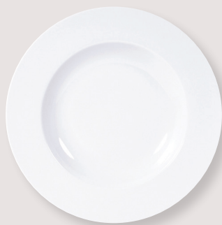
Assiette creuse à aile • Rim soup D. 29,5 cm H. 4,1 cm / D. 11.6" H. 1.6" 5100/3645