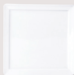
Assiette carrée • Square plate Samoa 13 x 13 cm H. 1,3 cm / Samoa 5.1" x 5.1" H. 0.5" 5100/3640