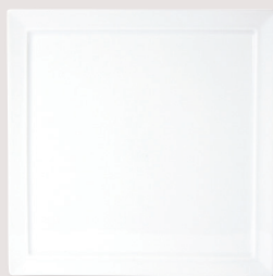
Assiette carrée • Square plate Tonga 29,5 x 29,5 cm H. 1,3 cm / Tonga 11.5" x 11.5" H. 0.5" 5100/3642 Fidji 26 x 26 cm H. 1,3 cm / Fidji 10.5" x 10.5" H. 0.5" 5100/5277 Wallis 21 x 21 cm H. 1,3 cm / Wallis 8.5" x 8.5" H. 0.5" 5100/7208