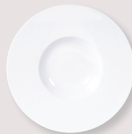
Assiette creuse à aile large Large rim plate D. 27 cm H. 5,5 cm / D. 10.6" H. 2.1" 5100/21273