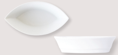
Coupelle Zanzibar • Zanzibar coupe

MM 27 x 13 cm H. 1,2 cm / Medium 10.6" x 5.1" H. 0.5" 5100/5278 PM 24 x 12 cm H. 1,2 cm / Small 9.4" x 4.7" H. 0.5" 5100/5532