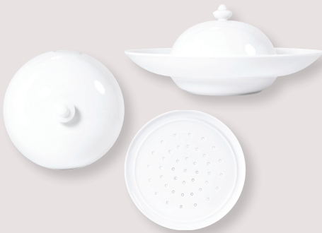
Assiette creuse Shogun Shogun coupe plate

D. 29 cm B. 15 cm H. 6,3 cm / D. 11.4" C. 6" H. 2.5" 5100/7182 D. 26 cm B. 12 cm H. 5,8 cm / D. 10.5" C. 4.7" H. 2.2" 5100/3637 Cloche H. 9 cm D. 16,5 cm / Bell cover H. 3.5" D. 6.5" 5100/3636 Grille H. 1,5 cm D. 18 cm / Steaming dish H. 0.6" D. 7" 5100/3635