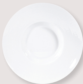
Assiette creuse Pacific Large rim plate Pacific D. 28,5 cm H. 6 cm / D. 11.2" H. 2.3" 5100/1759