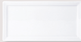
Assiette rectangulaire Rectangular plate

D. 29 cm B. 15 cm H. 6,3 cm / D. 11.4" C. 6" H. 2.5" 5100/7182 D. 26 cm B. 12 cm H. 5,8 cm / D. 10.5" C. 4.7" H. 2.2" 5100/3637 Cloche H. 9 cm D. 16,5 cm / Bell cover H. 3.5" D. 6.5" 5100/3636 Grille H. 1,5 cm D. 18 cm / Steaming dish H. 0.6" D. 7" 5100/3635