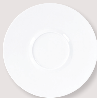
Assiette plate Shogun Shogun plate D. 29,5 cm H. 2,4 cm B. 11,5 cm / D. 11.5" H. 0.9" C. 4.5" 5100/5427 D. 26 cm H. 2,4 cm B. 10,5 cm / D. 10.5" H. 0.9" C. 4" 5100/5426