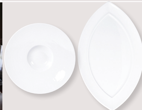
Coupe Pacific • Pacific coupe D. 23 cm H. 5 cm / D. 9" H. 1.9" 5100/3634