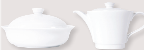
Marmite Shogun • Shogun tureen

10,5 x 7 cm H. 1,9 cm / 4.1" x 2.7" H. 0.7" 5100/7163