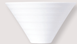
Bol Pacific • Pacific bowl

40 cl D. 15 cm H. 8,5 cm / 13.5 oz D. 6" H. 3.3" 5100/3633