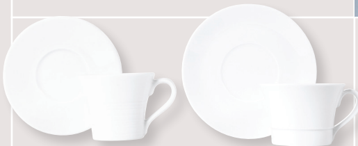
Tasse et soucoupe café Shogun Shogun espresso cup and saucer 5100/5562

Corps 18 cl / Base 6.1 oz 5100/5571 Couvercle / Lid 5100/5572