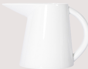
Broc Charlotte • Charlotte pitcher

Soucoupe D. 17 cm / Saucer D. 6.7" 5100/5567