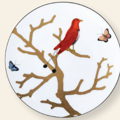
Assiette coupe 21 cm Coupe salad plate 8.5"