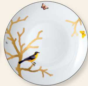
Plat rond creux 29 cm Deep round dish 11.5"