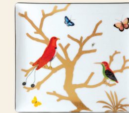
Plateau 22 x 19,5 cm Rectangular tray 8.5" x 7.5"