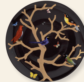
Coupe 36 cm ébène Large coupe 14"