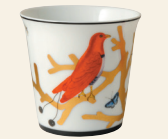
Pot + bougie parfumée 200g Tumbler + candle home fragrance 200g 2488/3843-1