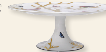
Plateau sur pied H. 12,5 cm D. 31 cm Footed cake platter H. 4.9" D. 12.2"