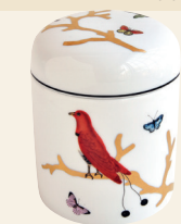
Boîte hermétique / Airtight box D. 10 cm H. 13 cm / D. 4" H. 5.1" 2488/22980 D. 10 cm H. 8,5 cm / D. 4" H. 3.3" 2488/22979