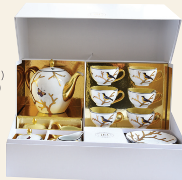
Coffret service à thé Tea gift case