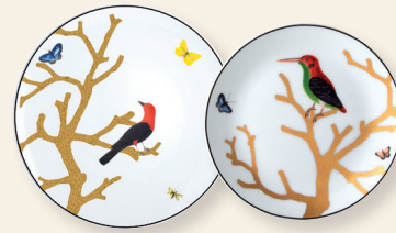
Assiette coupe 16 cm Coupe bread & butter plate 6.5"