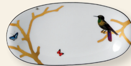
Ravier 23 x 12 cm Relish dish 9" x 5"