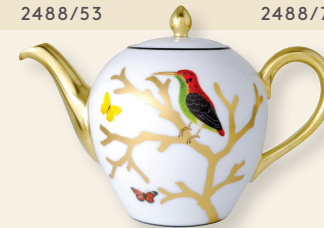
Théière Boule (75 cl) Tea pot Boule (25.5 oz)