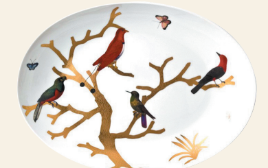
Plat ovale creux 39 cm Deep oval platter 15"