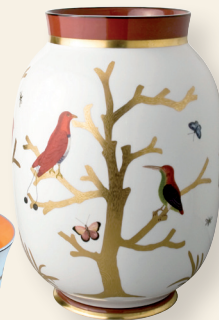
Vase Toscan 1 bis D. 23,5 cm H. 33,5 cm D. 9.5" H. 13.6"