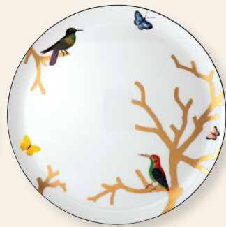
Plat à tarte 32 cm Round tart platter 13"