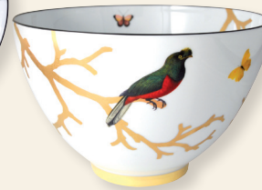
Saladier haut 27 cm (4,2 L) Deep salad bowl 10.5" (142 oz)