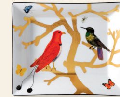
Vide-poches 20 x 16 cm Rectangular ashtray 8" x 6.5"