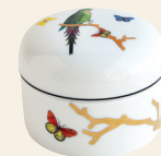
PT couverte (10 cl) Covered cup (3.5 oz) 2488/1305