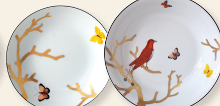
Assiette creuse calotte 19 cm Coupe soup 7.5"