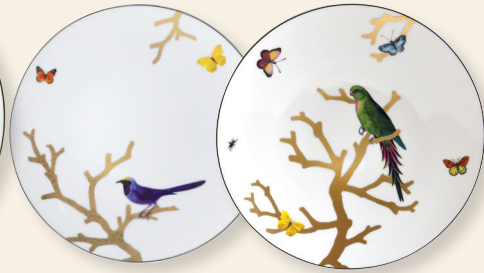
Assiette coupe 27 cm Coupe dinner plate 10.6"