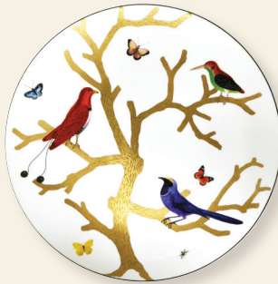
Assiette ultra plate 31 cm Ultra flat plate 12.2"