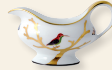
Saucière (25 cl) Gravy boat (8.5 oz)