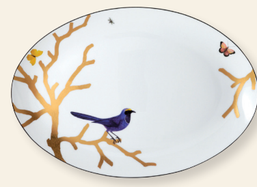
Plat ovale 38 cm Oval platter 15"