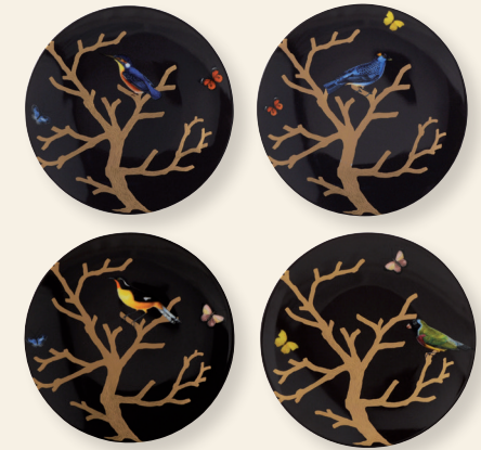
Coffret de 4 assiettes coupes 21 cm ébène Set of 4 coupe salad plates 8.5" ebony

REF 2488/21429 2488/2452 2488/21259 2488/2551