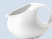
Saucière Gravy boat