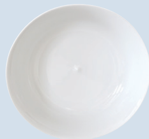
Compotier Open vegetable dish