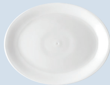
Plat ovale 39 cm et 33 cm Oval platter 15.5" and 13"