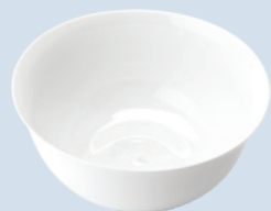
Saladier 25 cm et 20 cm Salad bowl 10" and 8"