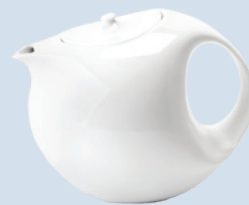
Théière (1 L) Tea pot (34 oz)