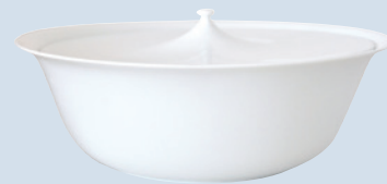
Soupière Open vegetable dish