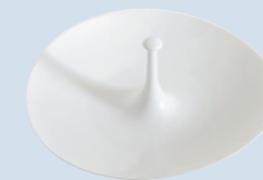
Coupelle GM Large fruit saucer