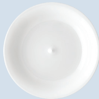
Plat rond creux 29 cm Deep round dish 11.5"