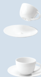
Tasse et soucoupe café (8 cl) A.D. cup & saucer (3 oz)