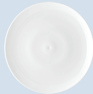
Assiette coupe 27 cm Dinner plate 10.6"