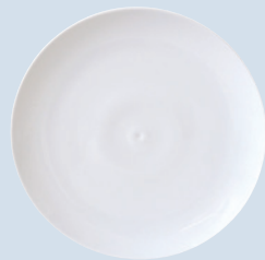
Assiette coupe 21 cm Dessert plate 8.5"