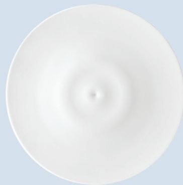
Assiette 31 cm Service plate 12"