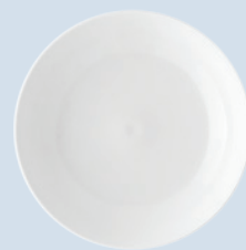
Assiette creuse calotte 19 cm Coupe soup 7.5"