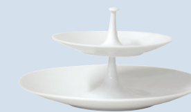
Serviteur 2 coupelles Two tier tray