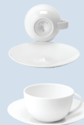
Tasse et soucoupe thé (13 cl) Tea cup & saucer (4.5 oz)