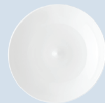
Assiette coupe 16 cm Bread & butter plate 6.5"