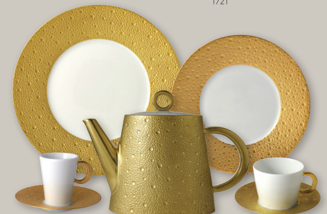
ECUME OR 0739