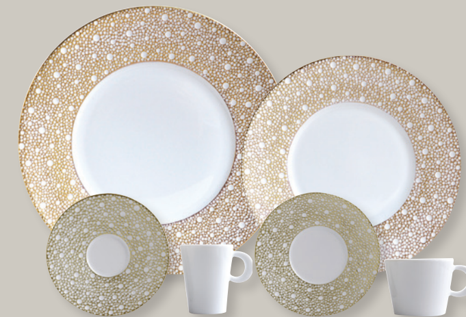
ECUME MORDORÉ 1721