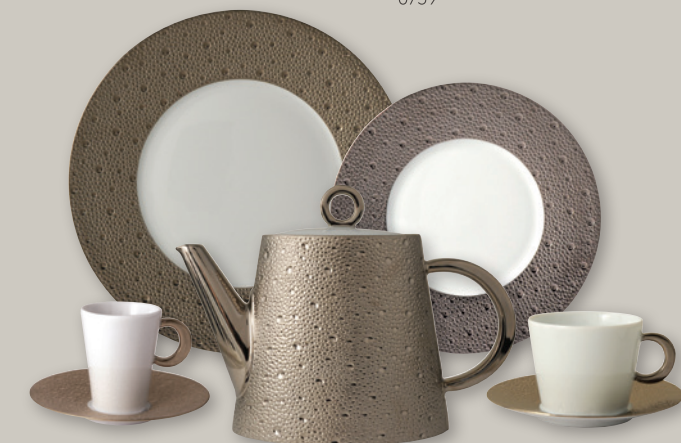
ECUME PLATINE 0738