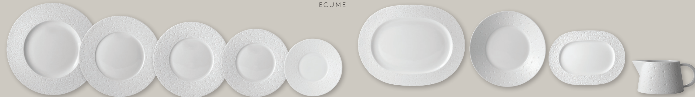
Assiette plate 31,5 cm Service plate 12.5" Assiette plate 26 cm Dinner plate 10.5" Assiette plate 16 cm Bread & butter plate 6.5" Plat ovale 30 cm, 35 cm, 43 cm Oval platter 12", 13", 17" Comptier creux 24 cm Open vegetable dish 9.5" Ravier 21,5 x 15 cm Relish dish 8.5" x 6" Saucière (40 cl) Gravy boat (14 oz)