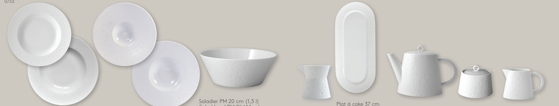
Assiette creuse à aile 23 cm Rim soup 9" Assiette creuse à aile large 27 cm Large rim soup 10.6" Assiette creuse à aile 29,5 cm Large rim soup 12" Coupe Pacific 23 cm Pacific coupe 9.5" Saladier PM 20 cm (1,3 l) Salad bowl PM 8" (44 oz) Saladier 24 cm (1,6 l) Salad bowl 9.5" (54 oz) Saladier 28 cm 3,5 l Large salad bowl 11" 118.5 oz Pot à sauce (25 cl) Sauce boat Grooseneck (8.5 oz) Plat à cake 37 cm Rectangular cake platter 15" Verseuse (1 l) Hot beverage server (34 oz) Sucrier (25 cl) Sugar bowl (8.5 oz) Crémier (25 cl) Creamer (8.5 oz)