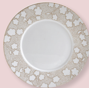
Assiette plate 21 cm Coupe salad plate 8.5"