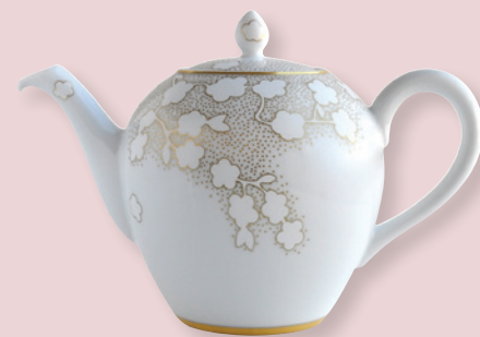
Théière Boule (1 L) Tea pot Boule (34 oz)