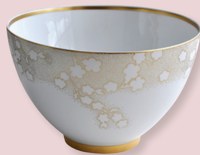
Saladier haut 27 cm (4,2 L) Deep salad bowl 10.5" (142 oz)