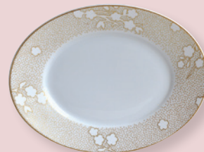
Ravier 21,5 cm x 10 cm Relish dish 8.5" x 3.9"