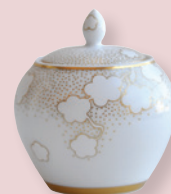
Sucrier Boule (30 cl) Sugar bowl Boule (12 oz)