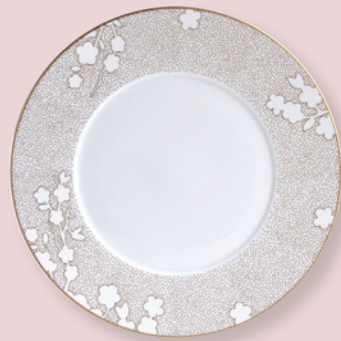
Assiette plate 27 cm Coupe dinner plate 10.5"