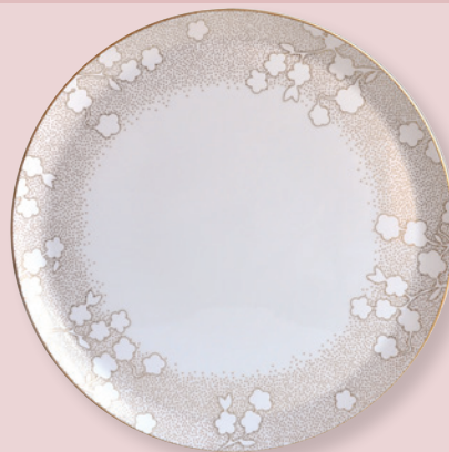
Plat à tarte 32 cm Round tart platter 13"