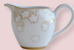
Crémier Boule (20 cl) Creamer Boule (7 oz)