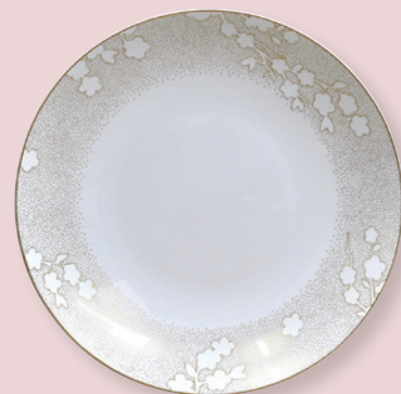
Plat rond creux 29 cm Deep round dish 11.5"