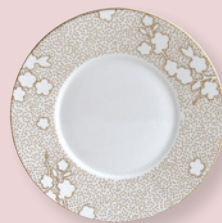
Assiette plate 16 cm Coupe bread & butter plate 6.5"