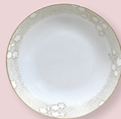
Assiette creuse calotte 19 cm Coupe soup 7.5"