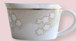
Saucière (30 cl) Gravy boat (10 oz)