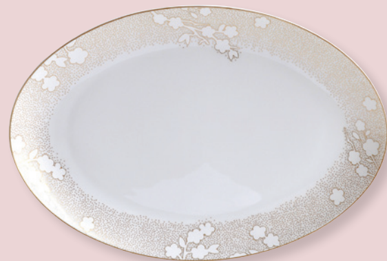
Plat ovale 33 & 38 cm Oval platter 13" & 15"