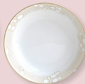
Compotier creux 24 cm (1 L) Open vegetable dish 9.5" (34 oz)