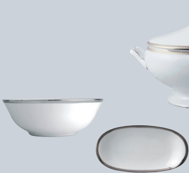
Saladier 25 cm (1,7 L) Salad bowl 10" (57 oz)