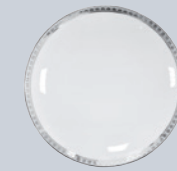
Assiette coupe 16 cm Coupe bread & butter plate 6.5"