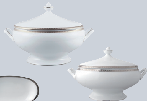
Soupière (2 L) Soup tureen (68 oz)