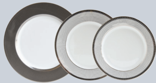
Assiette plate Studio 29,5 cm Dinner plate 11.5"