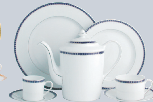
ATHENA NAVY 0464

REF 0448/127 0448/125 0448/147 0448/69 0448/105, 0448/107, 0448/109