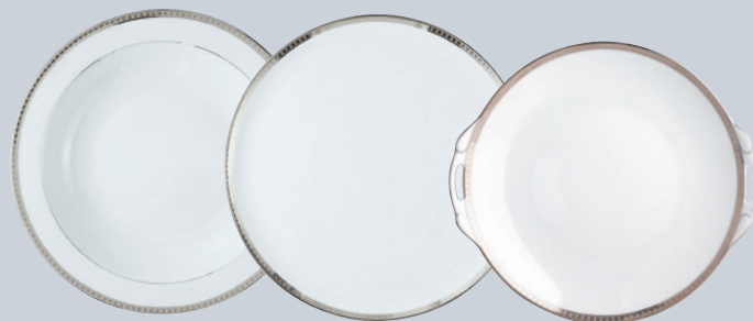
Plat rond creux 29 cm Deep round dish 11.5"