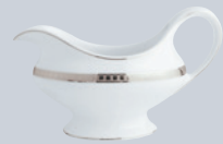
Saucière (25 cl) Gravy boat (8.5 oz)