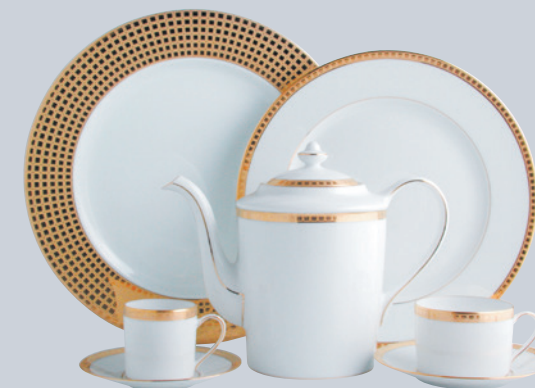
ATHENA OR 0467