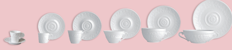
Tasse et soucoupe café (10 cl) A.D. cup & saucer (3.5 oz) Tasse et soucoupe thé (15 cl) Tea cup & saucer (5 oz) Bol et soucoupe bouillon (25 cl) Cream soup cup & saucer (8.5 oz)