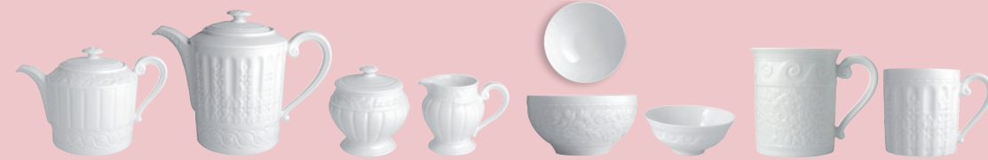
Théière (1 L) Tea pot (34 oz) Sucrier (25 cl) Sugar bowl (8.5 oz) Bol à céréales (30 cl) Cereal bowl (10 oz) Bol à riz (20 cl) Chinese rice bowl (6.8 oz) Mug (30 cl) Mug (10 oz)