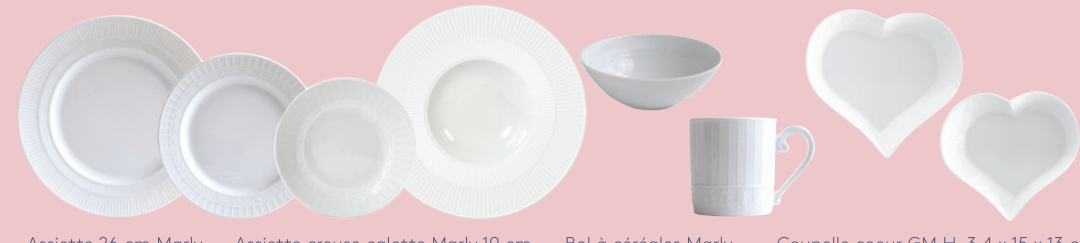
Assiette 26 cm Marly Dinner plate 10.5" Assiette creuse calotte Marly 19 cm Coupe soup 7.5" Marly Bol à céréales Marly Cereal bowl Marly Coupe coeur GM H. 3,4 x 15 x 13 cm Heart shaped large dish 5.9" x 5.1"