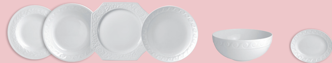
Assiette creuse à aile 22 cm Rim soup 9" Assiette carrée à hors d'oeuvre 23,5 cm Hors d'oeuvre platter 9.5"x 9.5" Saladier GM 28 cm (3,5 L) Large salad bowl 11" (118.5 oz) Ravier 20 x 16 cm Relish dish 8" x 6.5"