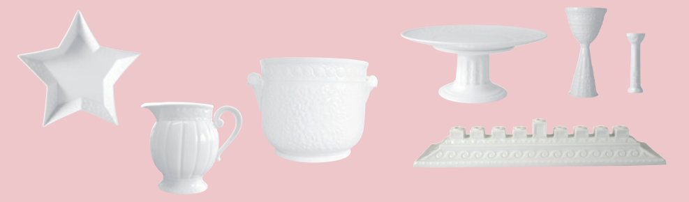
Assiette étoile creuse H. 4 cm L. 24 cm Star shaped dish 9.5" Jardinière H. 20 cm D. 22 cm Gardener H. 7.9" D. 8.7" Verre à Kiddush Kiddush cup Mezzuzah H. 10 cm Mezzuzah 3.9"

REF 147 133 109 107 20252 97 121 95 3455 3491 4828 3490 1848 6575