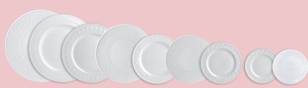
Assiette coupe 31 cm Oversized service plate 12.5" Assiette plate 26 cm Dinner plate 10.5" Assiette plate 21 cm Dessert plate 8.5" Assiette plate 19 cm Pastry plate 7.5" Assiette coupe 16 cm Coupe bread & butter plate 6.5"