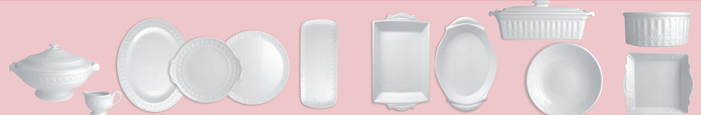
Soupière (2 L) Soup tureen (68 oz) Plat ovale 33 cm Oval platter 13" Plat à gâteaux 27 cm Cake plate with handles 11" Plat à cake 37 cm Rectangular cake platter 15" Plat à lasagnes 39 x 21 cm Rectangular baker 15.5" x 8.5" Terrine rectangulaire 35 x 13 cm (1,8 L) Rectangular terrine 14"x5" (61 oz) Moule à soufflé 20 cm (1,8 L) Round casserole 8" (61 oz)

22467 22468 22469 22470 22471 22472 20946 20945