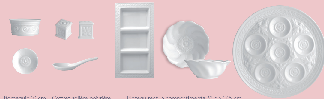
Ramequin 10 cm Ramekin 4" Coffret salière poivrière 5 x 3,5 x 3,5 cm Salt-pepper set 2"x 1.5"x 1.5" Plateau rect. 3 compartiments 32,5 x 17,5 cm Three-compartment tray 10.5"x 7"