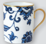
Mug cylindrique 8,5 cm Mug 3.4"