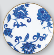
Assiette coupe 16 cm Coupe bread & butter plate 6.5"