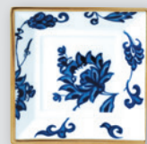
Cendrier 12 x 12 cm Medium square dish 4.5" x 4.5"