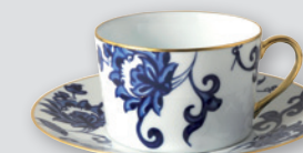
Tasse et soucoupe déjeuner (25 cl) Breakfast cup & saucer (8.5 oz)