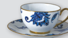
Tasse et soucoupe thé Boule (13 cl) Tea cup & saucer (4.5 oz)