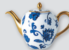
Théière Boule (1 L) Tea pot Boule (34 oz)