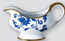
Ravier 23 x 12 cm Relish dish 9"x 5"