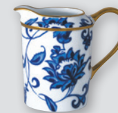
Crémier (30 cl) Creamer (10 oz)