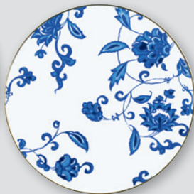
Assiette coupe 26 cm Coupe dinner plate 10.5"