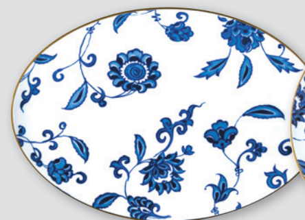
Plat ovale 38 cm Oval platter 15"