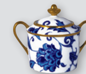
Sucrier (20 cl) Sugar bowl (7 oz)