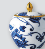
Sucrier Boule (35 cl) Sugar bowl Boule (12 oz)