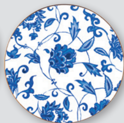
Assiette coupe 21 cm Coupe salad plate 8.5"