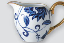
Crémier Boule (30 cl) Creamer Boule (10 oz)