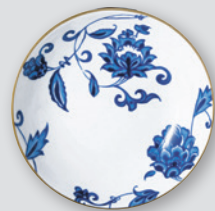
Assiette creuse calotte 19 cm Coupe soup 7.5"