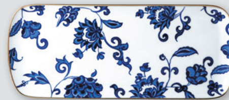
Plat à cake 37 cm Rectangular cake platter 15"