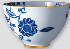
Saladier haut 27 cm (4,2 L) Deep salad bowl 10.5" (142 oz)