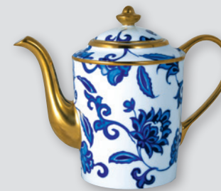
Cafetière (1 L) Coffee pot (34 oz)