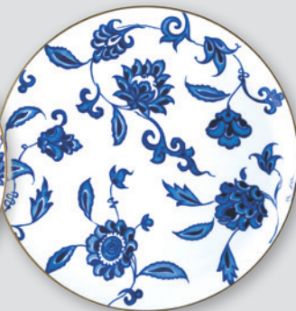
Plat à tarte 32 cm Round tart platter 13"