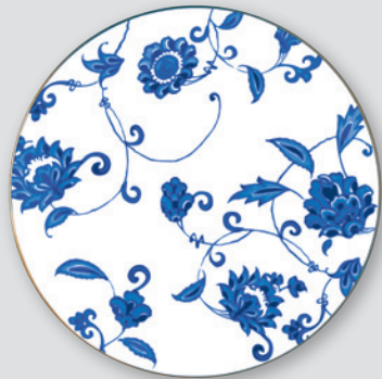
Assiette coupe 31 cm Coupe service plate 11.5"