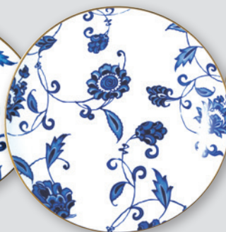
Plat rond creux 29 cm Deep round dish 11.5"