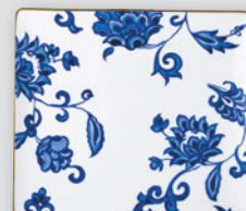
Plateau rectangulaire 22 x 19,5 cm Rectangular tray 8.5" x 7.5"