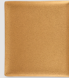
Plateau rectangulaire 27 x 23 cm Rectangular tray 10.6" x 9"