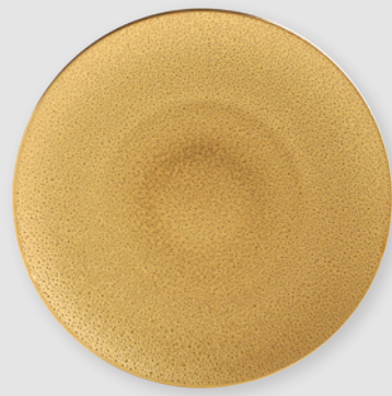
Assiette de présentation 31 cm Service plate 12"