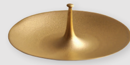
Coupelle GM 19,5 cm Fruit saucer large 7.7"