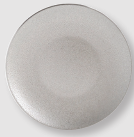
Assiette coupe 21 cm Coupe salad plate 8.5"