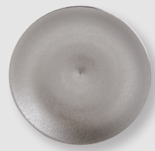
Coupelle 16 cm Saucer 6.5"