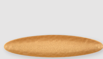
Coupe oblongue PM 31 x 7 cm Small oblong coupe 12.2" x 2.7"