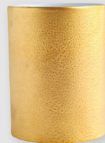
Vase H. 16 cm Vase H. 6.5"