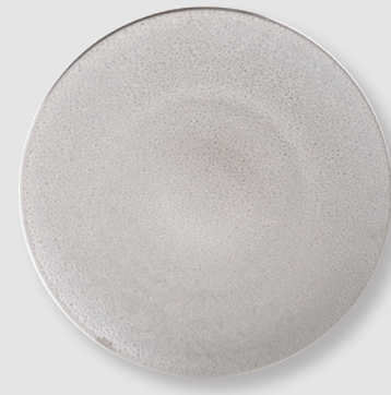
Assiette de présentation 31 cm Service plate 12"