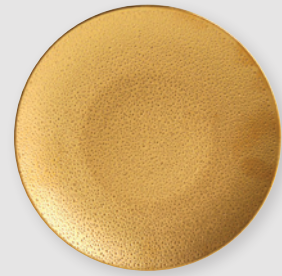
Assiette coupe 21 cm Coupe salad plate 8.5"