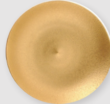
Coupelle 16 cm Saucer 6.5"