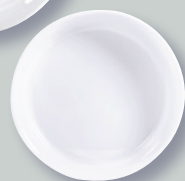
Plat rond creux 24 cm Deep round dish 9.5"