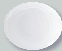
Assiette à Tapas D. 25 cm Tapas plate D. 9.8"