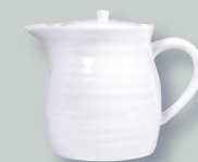
Verseuse (60 cl) Hot beverage server (20 oz)

REF 21416 / 21415 21580 21273 / 22475 115 / 21903 22105 22474 8179 4200