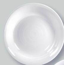
Plat rond creux 29 cm Deep round dish 11.5"