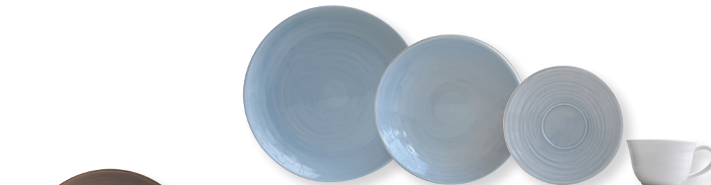
ORIGINE BLEU / BLUE

REF 21416 / 21415 21580 21273 / 22475 115 / 21903 22105 22474 8179 4200