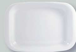
Plat à lasagnes 32 x 25 cm Rectangular baker 12.6" x 9.8"