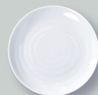
Assiette coupe 14 cm Bread & butter plate 5.5"