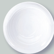
Assiette coupe 27 cm Dinner plate 10.6"