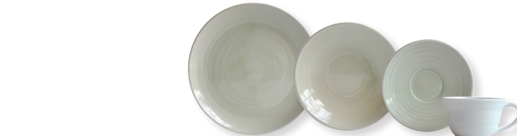
ORIGINE VERT / GREEN