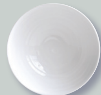
Saladier individuel D. 26,5 cm Salad bowl D. 10.6"