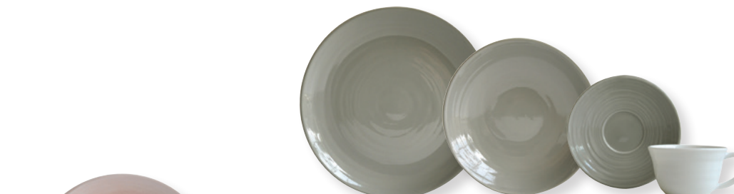
ORIGINE GRIS / GREY