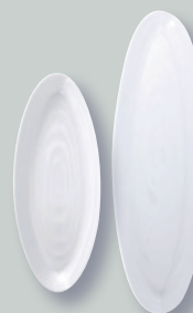
Coupe oblongue D. 27,5 cm / 41,5 cm Oblong coupe D. 11" / D. 17"

REF 26 3402 22473 53 / 21119 / 20515 79 89 21413 / 21313