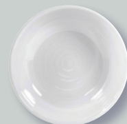
Compotier creux 25 cm / 30 cm / 35 cm Open vegetable dish 9.8" / 12" / 15"