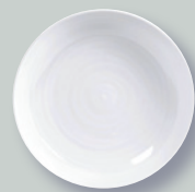
Assiette à pâtes D. 24 cm Pasta plate D. 9.5"