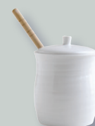
Pot à miel (20 cl) Honey pot (7 oz)