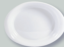
Plat à rôtir 32 cm Oval roasting dish 12.6"

REF 2134 21259 21260 21447 20972 1845 21904