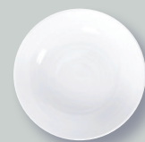
Assiette creuse calotte 19 cm Coupe soup 7.5"

REF 2134 21259 21260 21447 20972 1845 21904