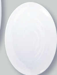
Plat ovale 35 cm Oval platter 13.8"