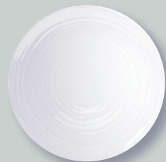
Assiette coupe 31 cm Service plate 12"