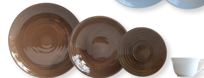
ORIGINE MARRON / BROWN