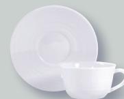
Tasse et soucoupe thé (20 cl) Tea cup & saucer (7 oz)