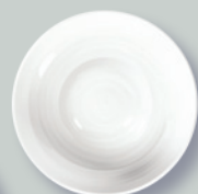
Assiette creuse à aile large 27 cm Large rim soup D. 10.6"