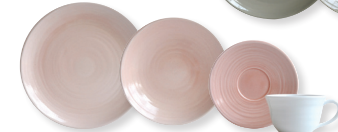
ORIGINE ROSE / PINK