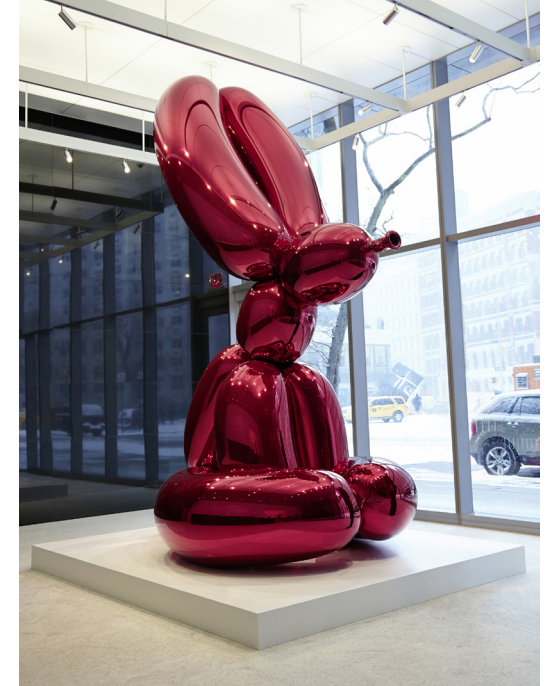
Balloon Rabbit (Red), 2005-2010, mirror-polished stainless steel with transparent color coating, 168 x 107 x 80 3/4 inches, 426.7 x 271.8 x 205.1 cm

Mais pourquoi un lapin ? Voici la réponse de Koons : « Cela vient de l'endroit où j'ai grandi, dans le sud du centre de la Pennsylvanie, en milieu rural. À certaines époques de l'année, les gens décoraient les jardins situés devant leur maison avec des objets comme des rennes à Noël. Au printemps, au moment de Pâques, ils disposaient des lapins, des lapins gonflables. J'ai toujours été frappé par la générosité des voisins qui faisaient plaisir aux autres de cette manière. L'une des choses dont je suis le plus fier, c'est de créer des œuvres qui permettent aux spectateurs de ne pas se laisser intimider par l'art et de sentir qu'ils peuvent participer totalement aux œuvres sur le plan émotionnel, grâce à leurs sens et à leur intellect. » Le lapin est une figure majeure de l'œuvre de Koons, dans laquelle elle apparaît pour la première fois en 1979 avec Inflatable Flower and Bunny (Tall White, Pink Bunny) , puis avec Rabbit (1986), œuvre en acier inoxydable constituant la première représentation de ce sujet avec une surface très réfléchissante, également employée pour Balloon Rabbit . Grâce aux surfaces semblables à des miroirs créées par Koons, le spectateur devient un élément essentiel de l'œuvre et, ce faisant, voit sa personnalité affirmée.