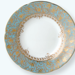
Assiette creuse à aile 22,5 cm Rim soup 9"