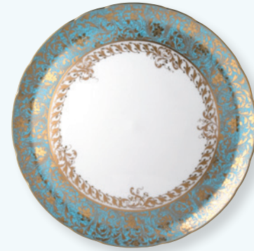
Plat à tarte 32 cm Round tart platter 13"