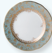
Assiette plate 16 cm Bread & butter plate 6.5"