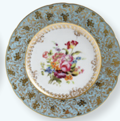
Assiette Bouquet 21 cm Salad plate plate 8.5"