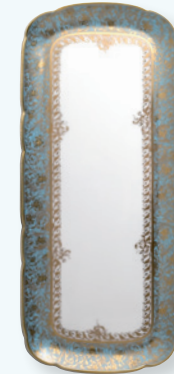
Plat à cake 37 cm Rectangular cake platter 15"