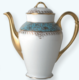
Cafetière (1 L) Coffee pot (34 oz)