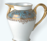
Crémier (30 cl) Creamer (10 oz)