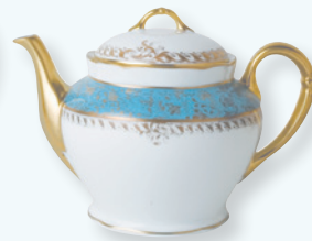
Théière (1,2 L) Tea pot (40.5 oz)