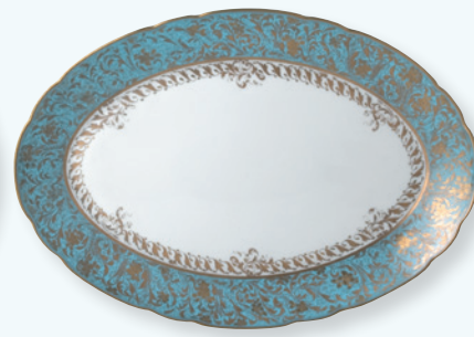
Plat ovale 33 cm & 38 cm Oval platter 13" & 15"