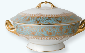
Soupière (2 L) Soup tureen (68 oz)