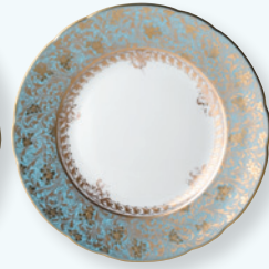
Assiette plate 21 cm Salad plate 8.5"