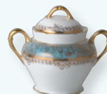
Sucrier (20 cl) Sugar bowl (7 oz)