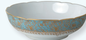
Saladier 25 cm (1,7 L) Salad bowl 10" (57 oz)