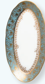
Ravier 23 x 12 cm Relish dish 9"x 5"