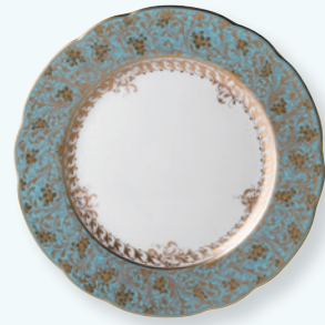
Assiette plate 26 cm Dinner plate 10.5"