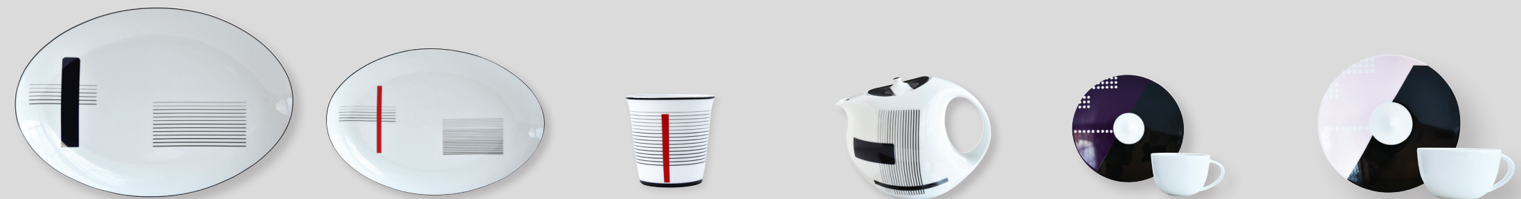
Plat ovale D. 38 cm Oval platter D. 15" Plat ovale D. 33 cm Oval platter D. 13" Pot + bougie parfumée 200g Tumbler + candle home fragrance 200g Théière Boule (1 L) Tea pot Boule (34 oz) Tasse et soucoupe café (7 cl) Coffee cup & saucer (2.5 oz) Tasse et soucoupe thé Boule (20 cl) Tea cup & saucer Boule (7 oz)

REF 1830/22298 1830/22299 1830/22300 1830/26 1830/21432 1830/7635 1830/21266