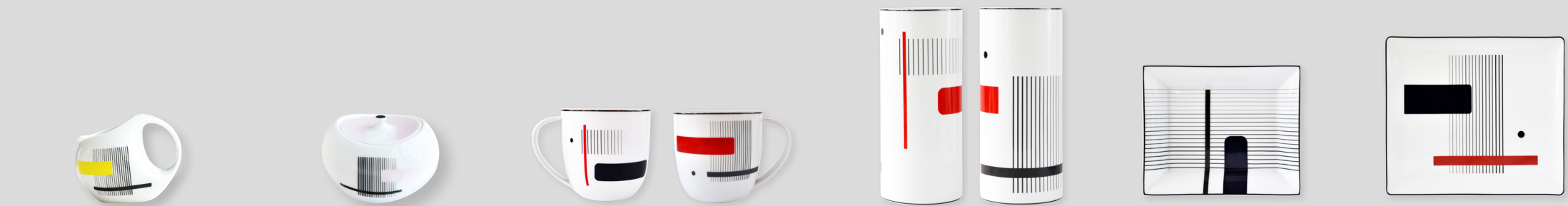
Crémier Boule (20 cl) Creamer Boule (7 oz) Sucrier Boule 30 cl Sugar bowl Boule 10 oz Recto Verso Mug Recto Verso Vase H. 28 cm D. 12 cm Vase 11" x 4,7" Vide_poches 20 x 16 cm Ashtray 8,7" x 6,5" Plateau 22 x 19,5 cm Tray 8,7" x 7,7"

REF 1830/107 1830/109 1830/3843 1830/9027 1830/79 1830/89