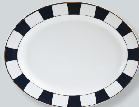
Plat ovale D. 38 cm Oval platter D. 17"