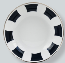
Assiette creuse calotte D. 19 cm Coupe soup D. 7.5"