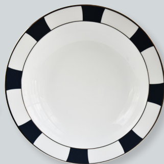
Plat rond creux D. 29 cm Deep round dish D. 11.5"