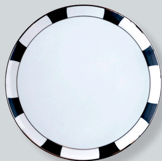
Plat à tarte D. 32 cm Round tart platter D. 13"