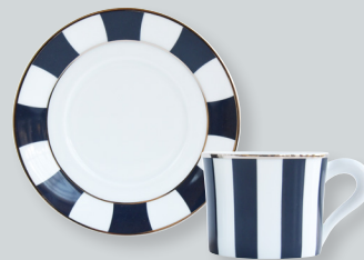
Tasse et soucoupe thé (20 cl) Tea cup & saucer (7 oz) 1856/89 Coffret de 2 / Set of 2 1856/22665 Coffret de 4 / Set of 4 1856/22666