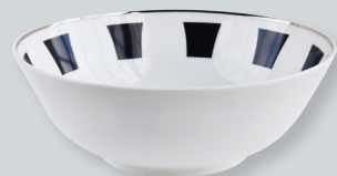
Saladier (1,7 L) D. 25 cm Salad bowl (57 oz) D. 10"