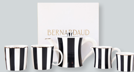
Coffret service à thé Comprenant: 1 théière (50 cl), 2 mugs, 1 timbale et 1 crémier Tea gift case Composed of: 1 tea pot, 2 mugs, 1 tumbler and 1 creamer