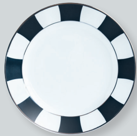
Assiette plate / Plate D. 26 cm / D. 10.5" D. 21 cm / D. 8.5" D. 16 cm / D. 6.5"