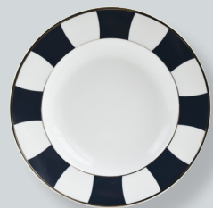
Assiette creuse à aile D. 22,5 cm Rim soup plate D. 9"