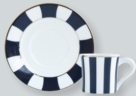
Tasse et soucoupe café (8 cl) Coffee cup & saucer (3 oz) 1856/79 Coffret de 2 / Set of 2 1856/21957 Coffret de 4 / Set of 4 1856/22664