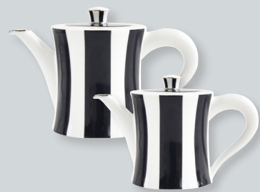
Verseuse GM (1 L) Small hot beverage server (34 oz) 1856/8186