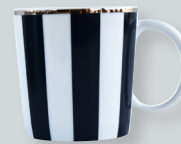
Mug (20 cl) / (6.5 oz) 1856/22575 Coffret de 2 / Set of 2 1856/23335